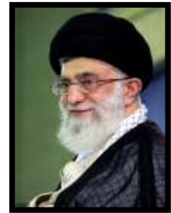
مقام معظم رهبری (مد ظله)

خدمت بی منت به آحاد مردم نعمتی الهی برای مسئولان است