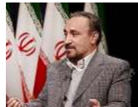
استاندار محترم سمنان

تحقق همدلی و خدمت رسانی به مردم وظیفه اصلی مسئولین است و خدمت به مردم بهترین نعمت است.