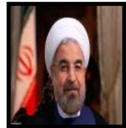
ریاست محترم جمهوری

وفاق و هماهنگی همه مسئولان نظام برای خدمت رسانی به مردم و توسعه کشور ضروری است.